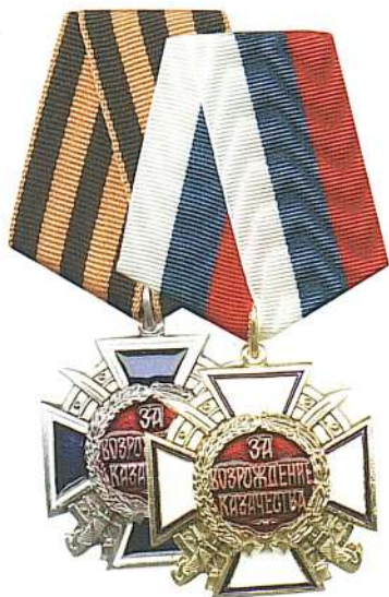
Наградной крест «За возрождение казачества» 1 степени