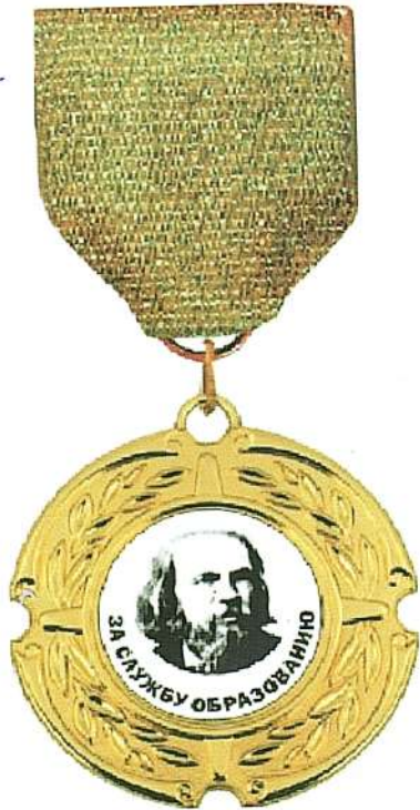
МЕДАЛЬ «ЗА СЛУЖБУ ОБРАЗОВАНИЮ»

Учреждена Некоммерческой организацией Благотворительный фонд наследия Менделеева