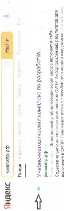
Рисунок 1. Поисковая строка

В поисковую строку вводим «умксипр.рф». Выбираем (Рис. 1).