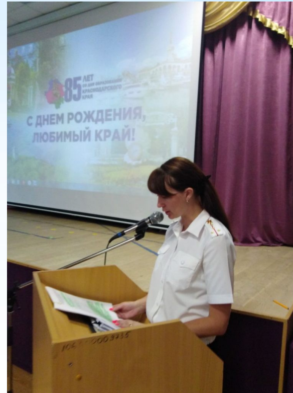
В рамках месячника «Безопасная Кубань» старший сержант пожарной службы провел инструктажи с учащимися по пожарной безопасности и антитеррористической защищённости