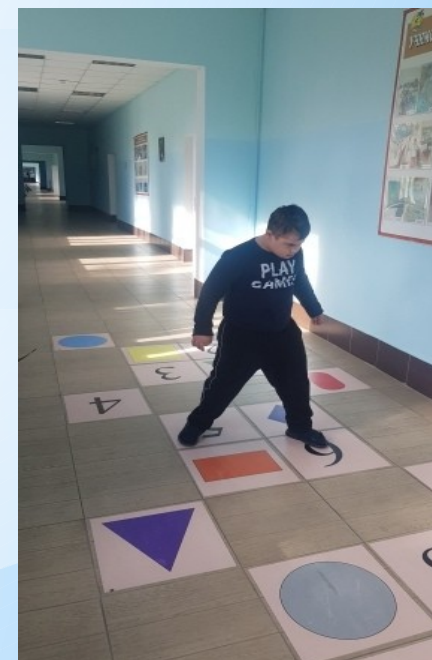
Занятия на ранее разработанных и обновленных пространствах "Классики 21 века"